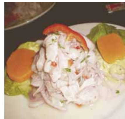
Ceviche, prato típico peruano, peixe cru marinado no limão