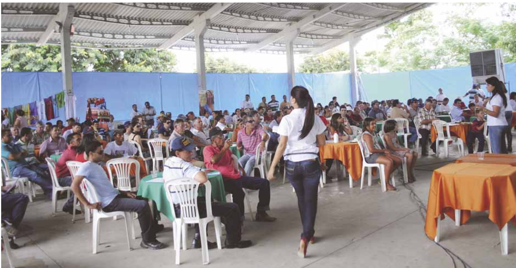
O público presente, grande em quantidade e qualidade foi formado de produtores rurais de Carlos Chagas, de todo o Mucuri e de cidades dos estados da Bahia e Espírito Santo

O Leilão do Fazendeiro, realizado sábado, dia 4 de fevereiro é mais um evento do Sindicato Rural de Carlos Chagas junto com a Safra Leilões. Como das outras vezes foi mais um sucesso de organização e mobilização por parte dos organizadores. Deu prá sentir também a satisfação dos produtores rurais de todo nordeste mineiro e dos baianos e capixabas, personalidades constantes e importantes nos leilões de Carlos Chagas.