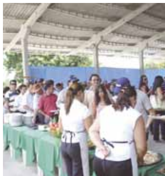
Primeiro foi servido o almoço