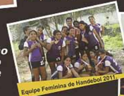
Equipe Feminina de Handebol 2011