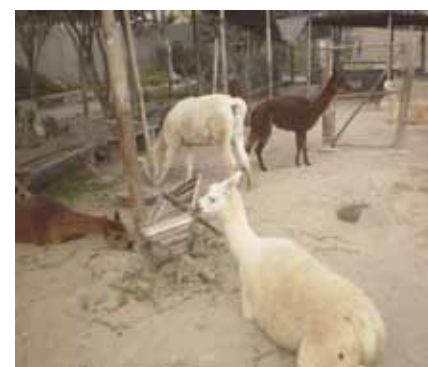
Lhamas e Opacas no Huaca Pucllana