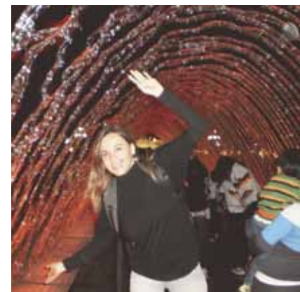
Fonte do Circuito Mágico das Águas