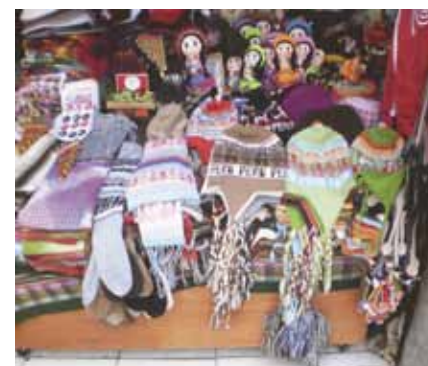
Artesanatos típicos Peruanos, gorros, luvas, encharpes e casacos feitos com Tecido confeccionado à partir com fibras ou pêlo de alpaca, animal semelhante à lhama