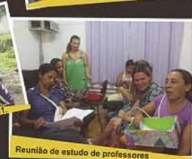
Reunião de estudo de professores

Mais informações pelo telefone 3624 1555 ou no nosso blog: http://informativogirassol.blogspot.com