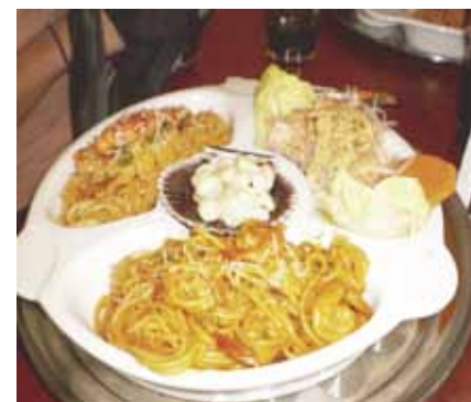
Pratos típicos peruanos à base de frutos do mar