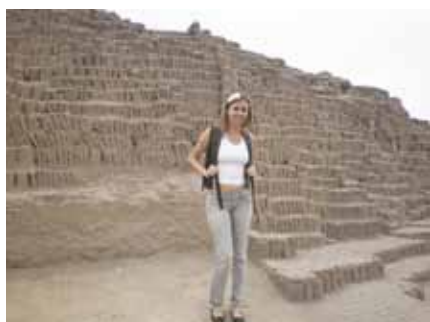
Visita parque arqueológico Huaca Pucllana

O tema do CIBIA de 2011 foi “a chave para a inovação”, dentro