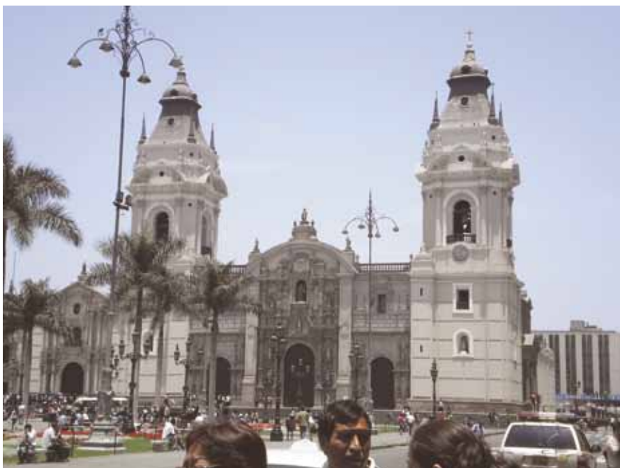
A Basílica Catedral de Lima y Primada del Perú ou simplesmente Catedral de Lima é a Igreja Maior do Peru localizada no centro histórico de Lima

ocorre em outras universidades fora do nosso país.