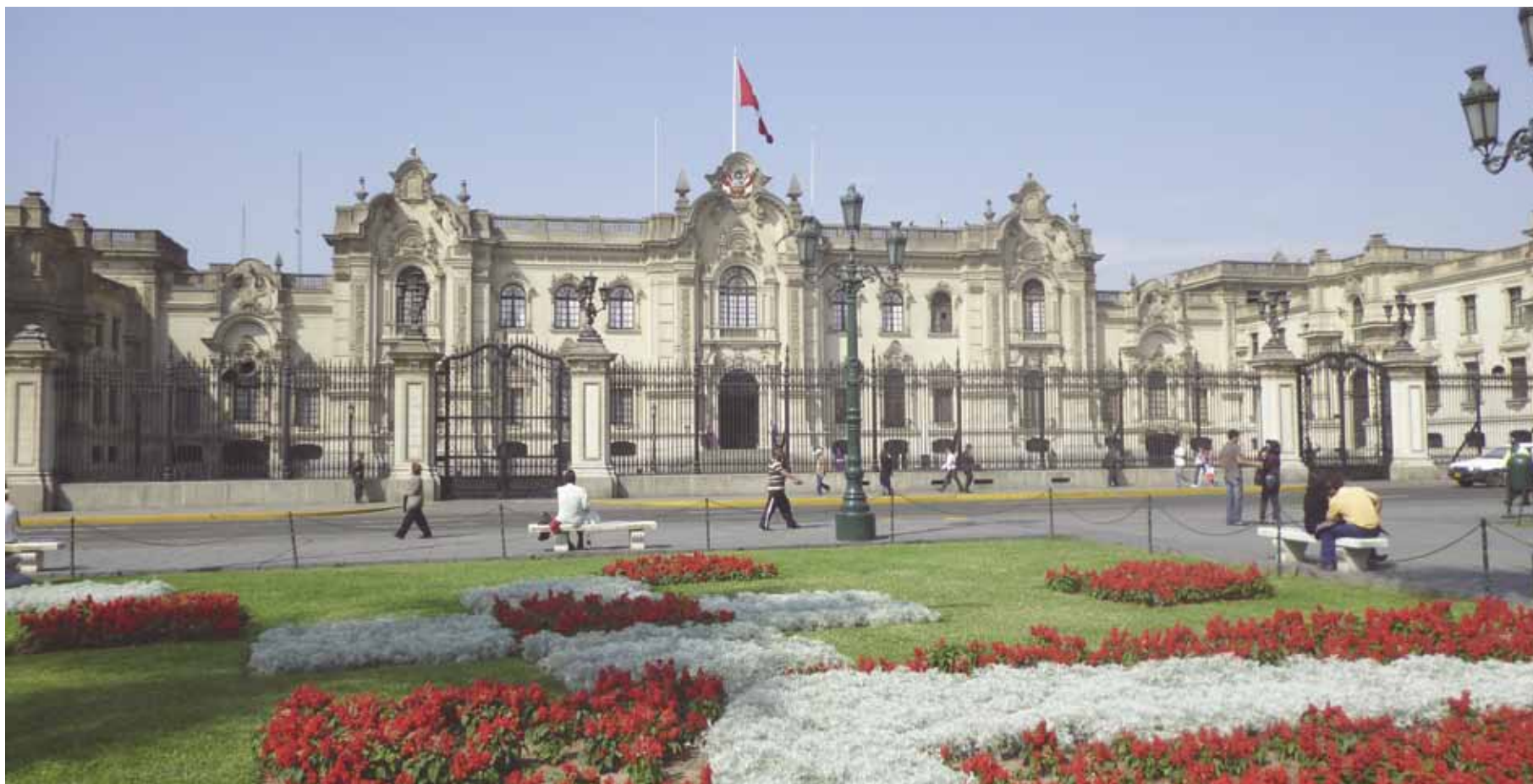
Palácio do Governo do Peru ainda conhecido como Casa de Pizarro

N os dias 23 a 26 de outubro aconteceu em Lima-Peru o VIII Congresso Ibero-americano de Ingeniería de Alimentos o CIBIA, que contou com a participação dos mais renomados intelectuais da área acadêmica voltada para a engenharia de alimentos. Neste congresso pude apresentar alguns dados de minha dissertação em forma de poster, com o trabalho intitulado “Estudo da Cinética de CM-Case produzida a partir da fermentação no estado sólido de resíduo de acerola ( Malpighia emarginata D.C.)” que é fruto de meu experimento de mestrado, onde trabalho produzindo enzimas a partir de resíduos agroindustriais.