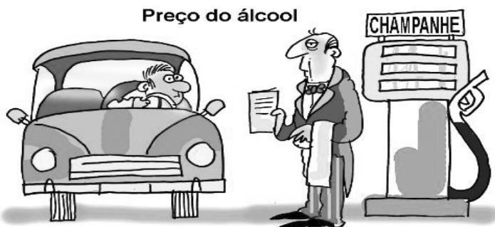
Preço do álcool