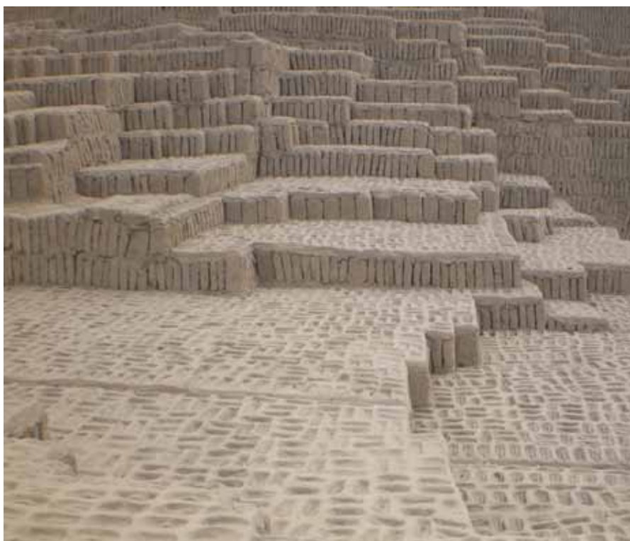
Visita parque arqueológico Huaca Pucllana, maravilhoso templo da época Pré-Inca, construído à 300 anos DC

Hospedei-me em Miraflores, um bairro nobre onde há uma simpática orla marítima com belíssimos parques floridos, e é onde há o Shopping Larcomar, que vale à pena conhecer, não pelas lojas em si, mas pelo local, maravilhoso. O shopping foi construído descendo a encosta, e tem uma vista linda do Oceano Pacífico. No centro de Miraflores ainda fica Huaca Pucllana,