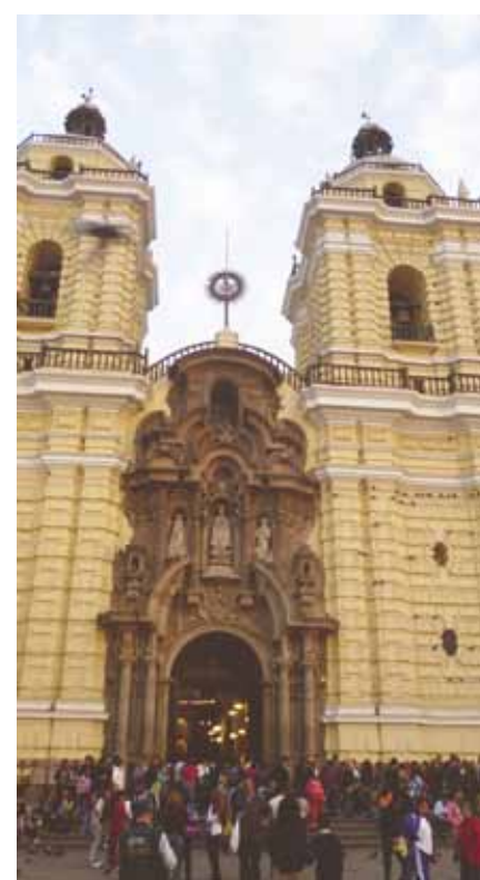
Igreja de São Francisco, de 1540

existem programas especiais para sua entrada nas universidades brasileiras, como no programa de pós-graduação da Universidade Federal de Viçosa, onde não precisam passar pelo processo seletivo que as pessoas brasileiras passam, precisando somente se inscrever no programa e passar por uma avaliação de currículo, como também