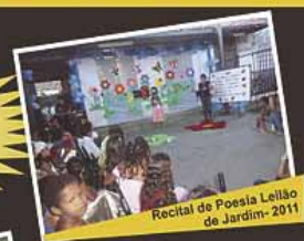
Recital de Poesia Lellão de Jardim-2011

Para continuar nesse caminho de descobertas, garanta já a vaga do seu filho na Escola Estadual Dr. João Beraldo. Quem estuda sabe mais e se prepara melhor para um mundo de oportunidades.