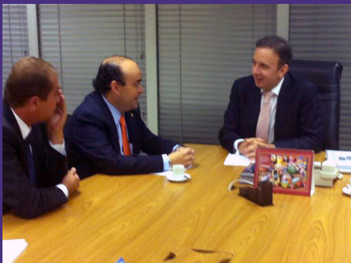
Audiência com o ministro das Cidades, Aguiinaldo Ribeiro.