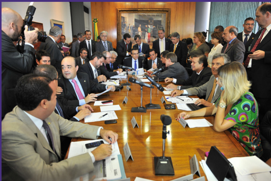
Reunião de líderes com o presidente da Câmara, Henrique Alves, discute a pauta de votações do Congresso.

Audiência pública realizada pela Comissão de Agricultura, a pedido dos deputados Bernardo Santana e Abelardo Lupion, discutiu a disponibilidade do crédito rural para a agropecuária brasileira nos últimos cinco anos.