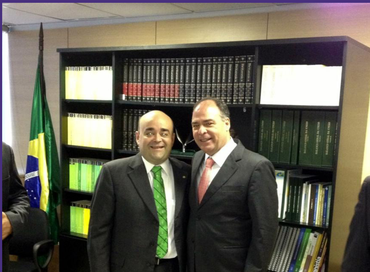
Audiência com o ministro da Integração Nacional, Fernando Bezerra discute a retomada das obras da Barragem de Berizal.