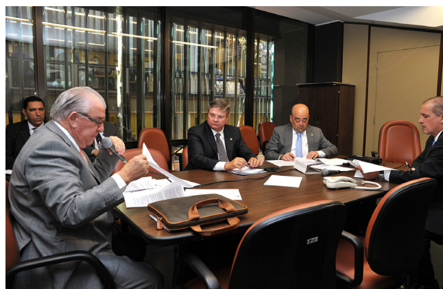
Primeira reunião da Subcomissão.

O deputado Bernardo Santana foi designado relator da Subcomissão Permanente de Controle à Cartelização do Agronegócio no Brasil, criada no âmbito da Comissão de Agricultura.