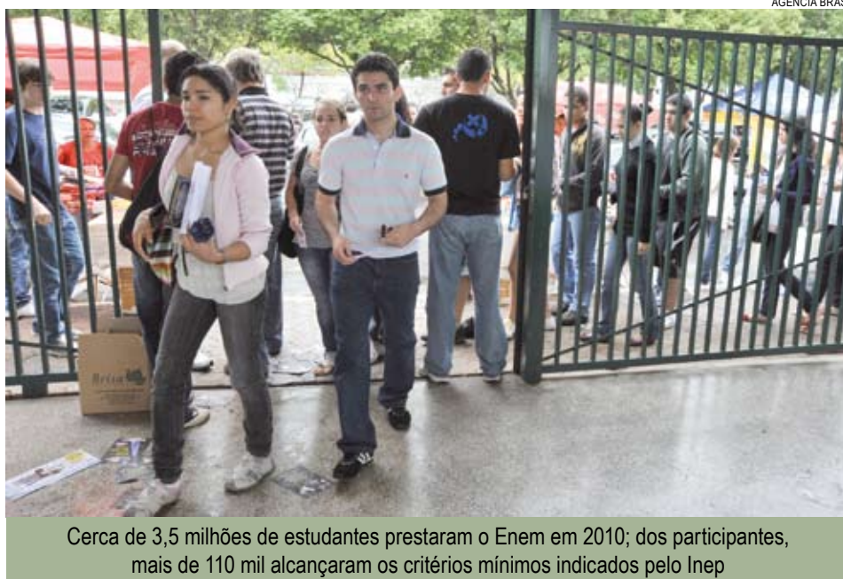
Cerca de 3,5 milhões de estudantes prestaram o Enem em 2010; dos participantes, mais de 110 mil alcançaram os critérios mínimos indicados pelo Inep

O deputado Otavio Leite (PSDB-RJ) também pediu mudanças no atual modelo de gestão do Ministério da Educação. “Há uma falha muito séria do ponto de vista da gestão do modelo”, disse. Ele ressaltou que é favorável ao Enem, pois o exame possibilita uma concorrência mais democrática