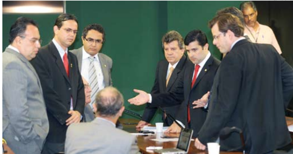
Foram arquivadas as oito CPIs que funcionaram na legislatura passada, entre elas a de Tarifas de Energia Elétrica, cujo relatório não foi votado