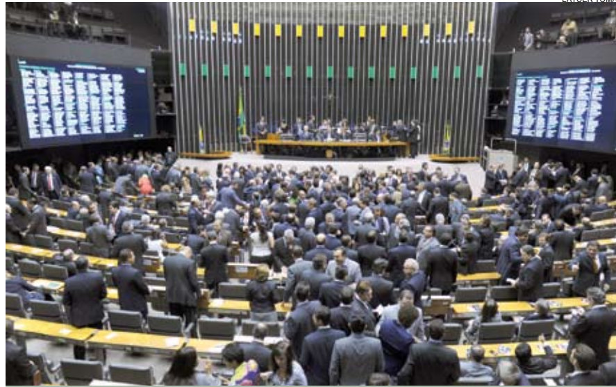
Deputados que tomaram posse na última terça-feira (1º) iniciam as votações em Plenário amanhã; o primeiro item da pauta é a MP 502/10, que amplia a bolsa-atleta

Jogos Olímpicos - Ainda na área esportiva, a MP 503/10 ratifica o protocolo de intenções assinado entre a União, o estado do Rio de Janeiro e a